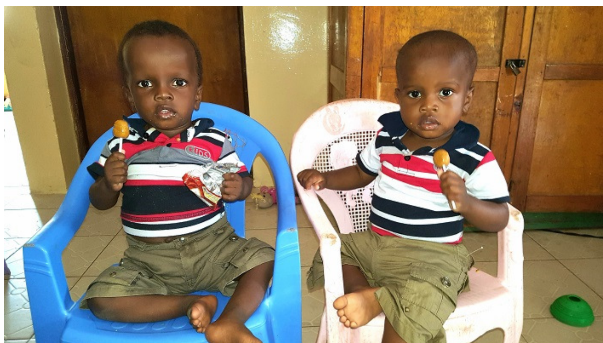
Tvillingar från Turkana räddade till livet

Trognistans Mission, Box 1112, 821 13 Bollnäs