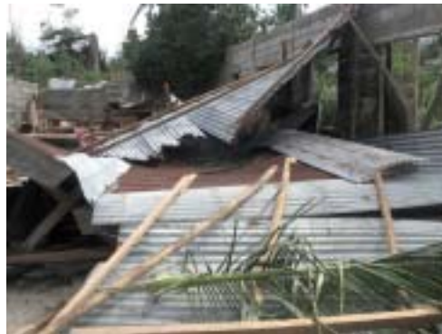
Kyrkor, hus och även stora byggnader förstördes av tyfonen Bopha