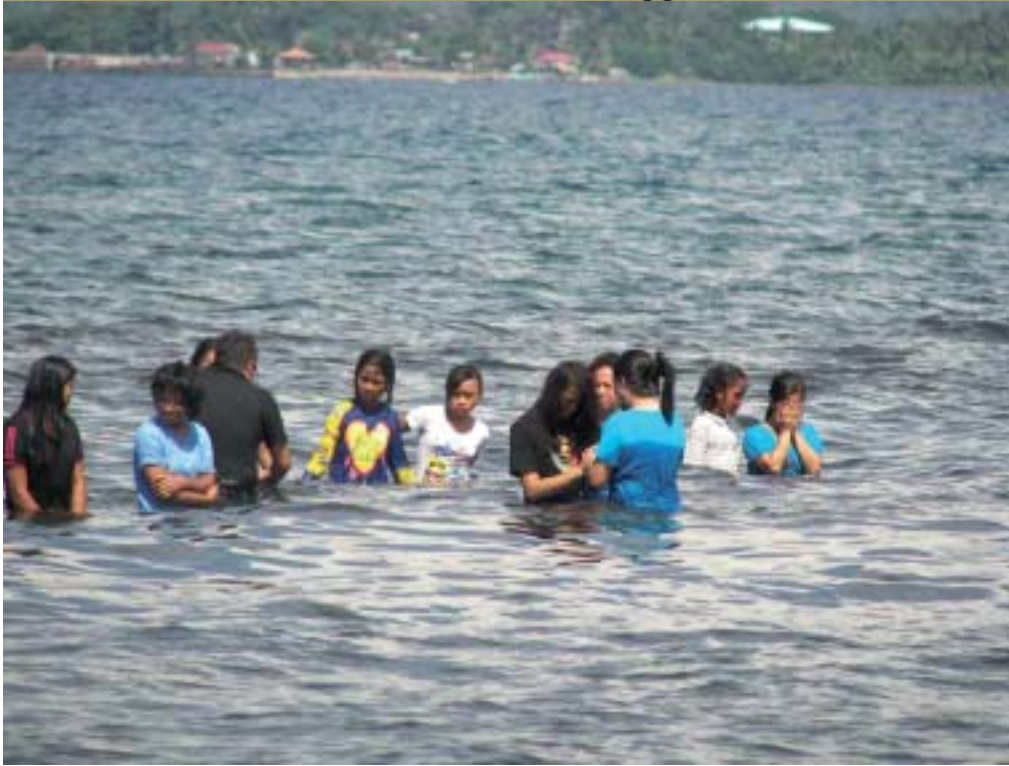
Bild t v. Matutdelning efter tyfonens förstörelse. Bild ovan: Dopförättning i Oceanen.

Vi lyfter fram David Livingstone som böneämne. Ett under är vad de ber om, men om inte detta sker så behövs över 50 000 kr till operation. Vill du hjälpa så sänd in din gåva till Trosgnistans pg 90 02 71-8 och märk betalningen: "David Livingstone, Indien"