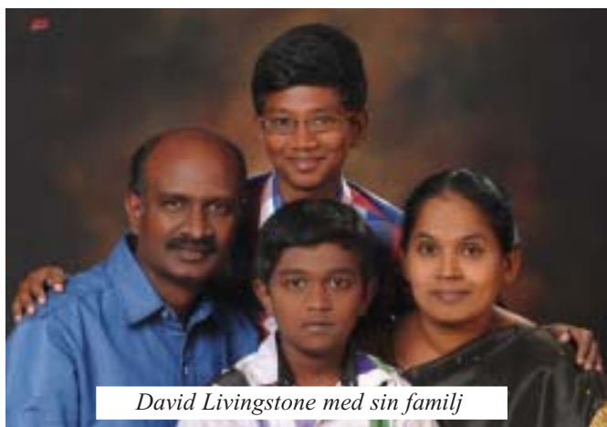
David Livingstone med sin familj