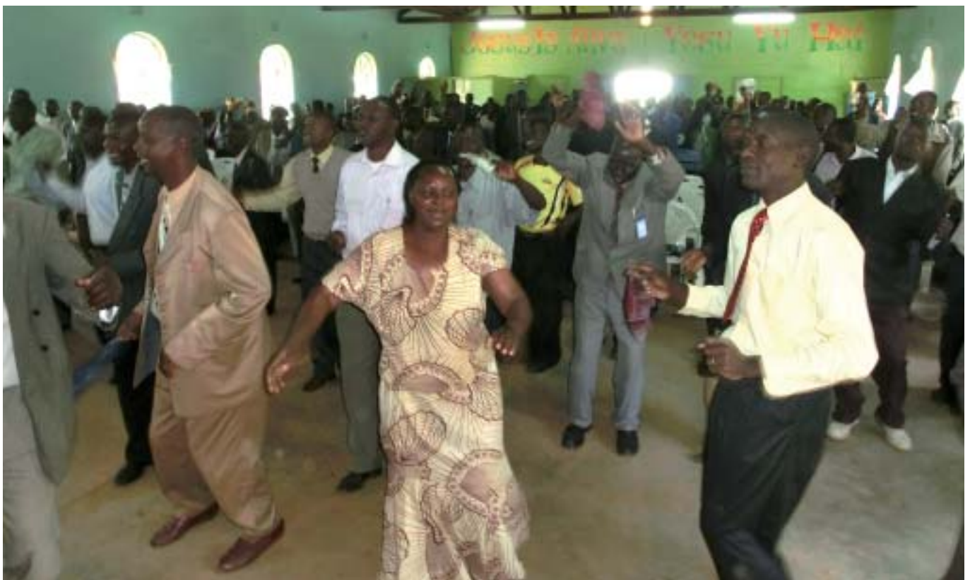
Lovprisning, dans och glädje i Eldoret