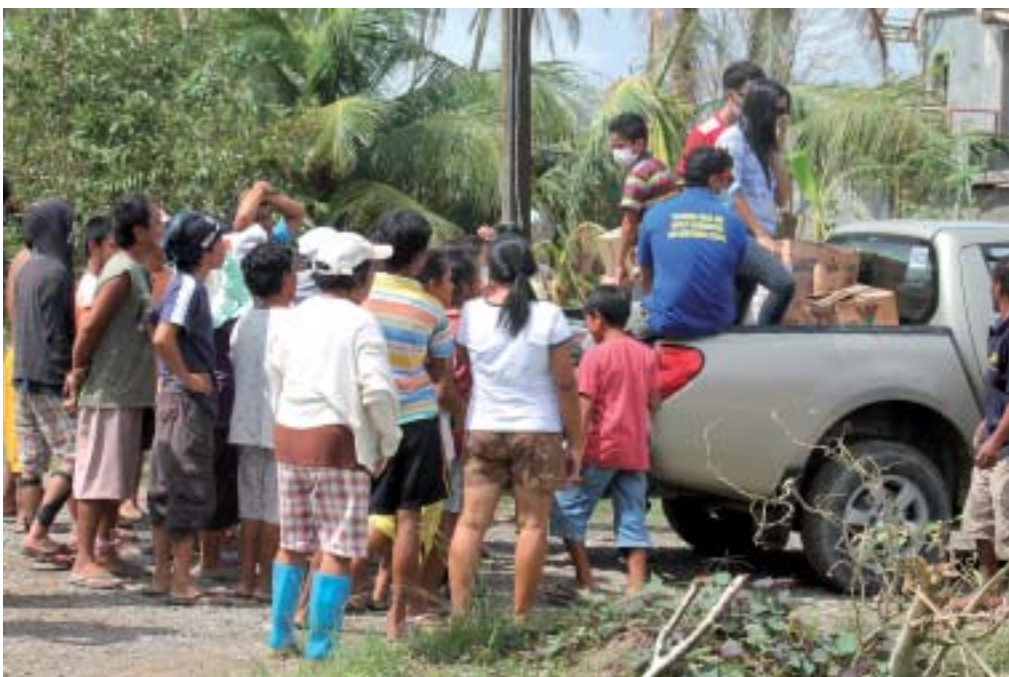
En bil kommer lastad... med mat till de hungriga