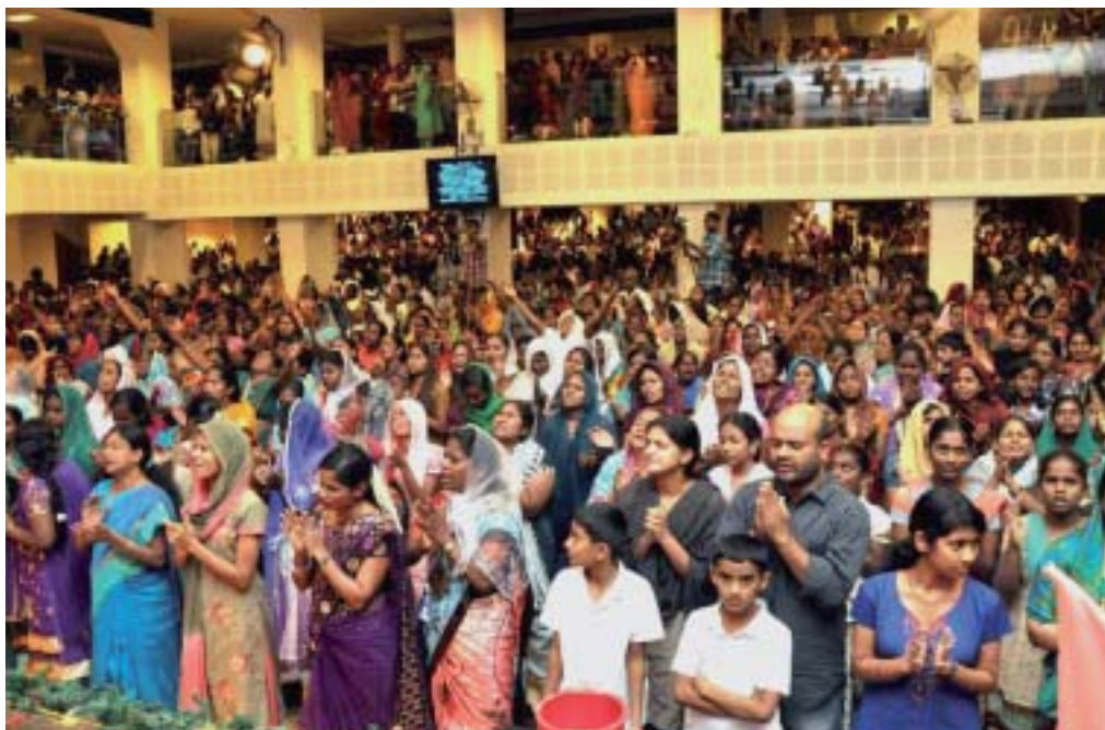
Under nyårshelgen samlades 7000 människor i Coimbatore