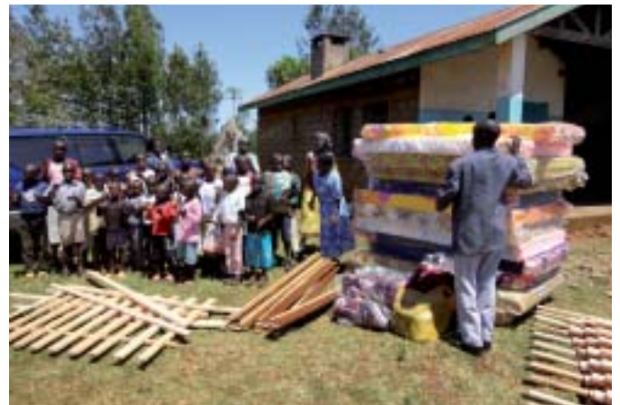
Bild ovan: Nya sängar, madrasser, filtvaror och köksutrustning levererades till barnhemmet i Lwala

För övrigt har vi haft fullt upp att ordna med reparationer och underhåll, både i Migori och Komotobo. Nu är vi hemma i Sverige igen, tacksamma över att ha fått göra ännu en insats i Kenya.