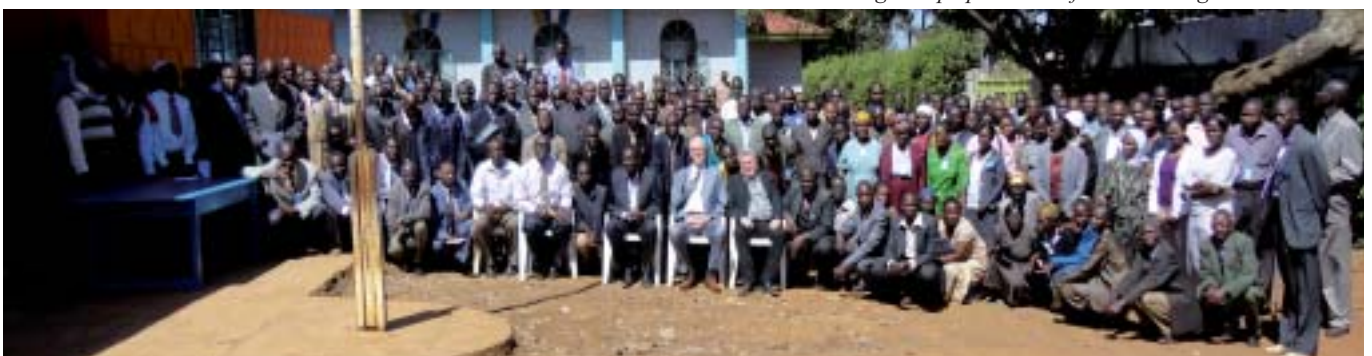
Bild nedan: Deltagarna på pastorskonferensen i Migori