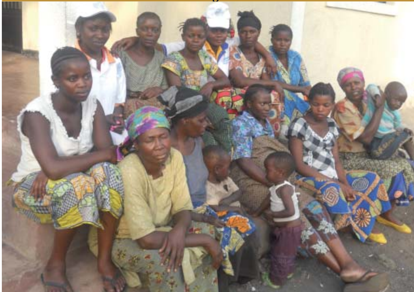
Några av kvinnorna som fått hjälp genom Trosgnistans Mission Vill du ge en gåva till arbetet bland Kongos utsatta kvinnor; sänd din gåva till Trosgnistan, Pg 900271-8. Märk gåvan "Kongos kvinnor".

smittats med hiv/aids vid våldtäkten. Ska hennes liv kunna återgå till det normala?