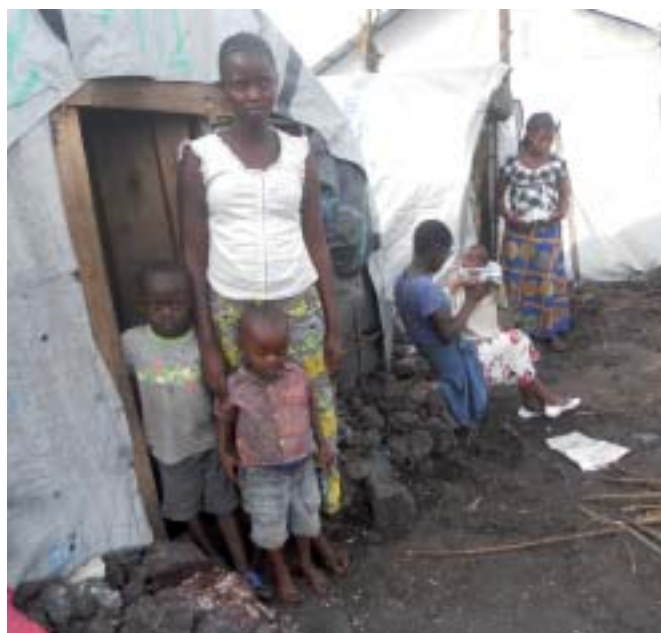
På Mugunga flykting-förläggning har man ett speciellt tält, där de våldtagna kvinnor får bo tillsammans.

Tack till alla er som har gjort det möjligt för oss att hjälpa Kongos kvinnor!