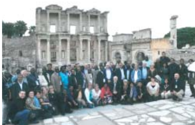
Deltagarna framför Celsus biblioteket i Efesus

Återigen samlades Trosgnistans ledare och medarbetare till en Align konferens som denna gång hölls i Turkiet. Temat för veckan var "Leadership in crises" (ledarskap i tider av kris").