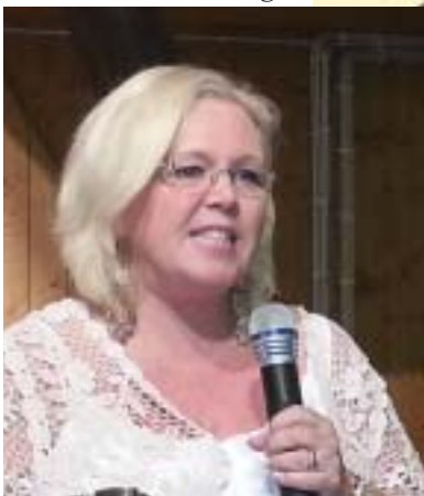
▶ Bön för världens länder