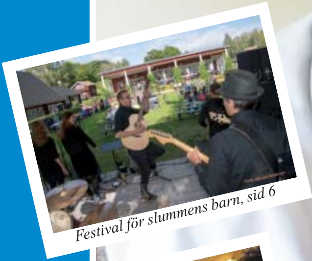
Festival för slummens barn, sid 6