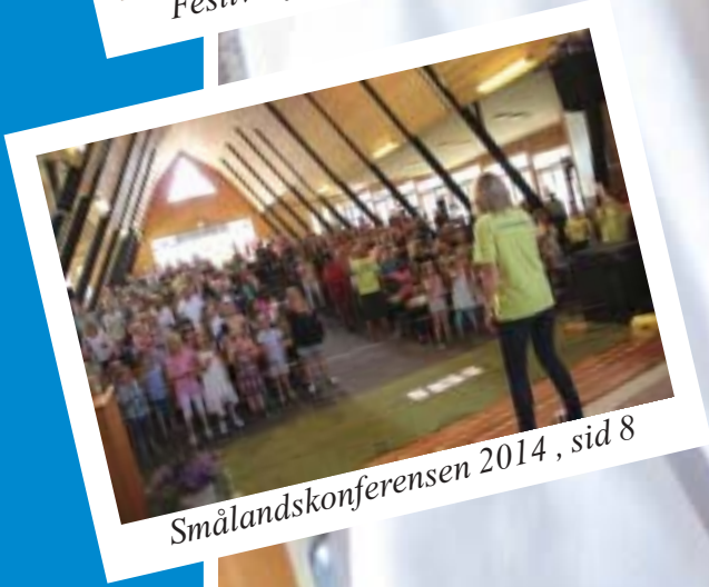
Smålandskonferensen 2014, sid 8